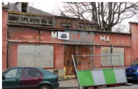
Le Modern cinéma d'Argenteuil

(Les connaisseurs des salles de cinéma d'Argenteuil sont les bienvenus pour cette séance, le réalisateur est très curieux de connaître l'histoire des salles de cinéma de la ville et de ce qu'elles sont devenues).